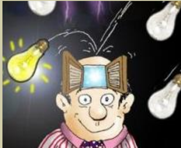
Idea de negocio